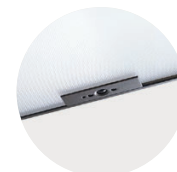
Multisensor / HCL / Swarm Control