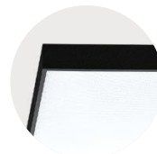
B Jet Black