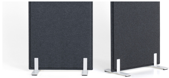
Doppelfußausleger bei Breite 700 mm