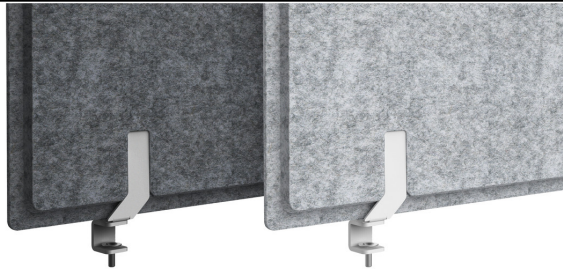
Tischplattenklemme für 19-25 mm Platten