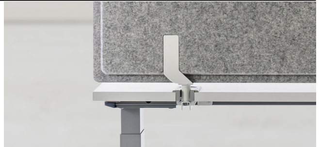
Befestigung an STAGE SX