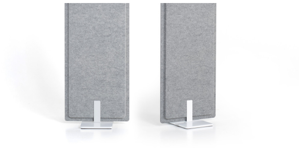
Bodenplatte bei Breite 410 mm