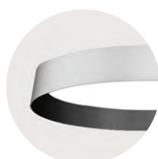
A Satin Silver B Jet Black