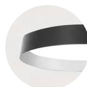
B Jet Black A Satin Silver