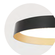
B Jet Black G Satin Gold