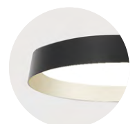
B Jet Black H Anodic Champagne