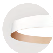
W Snow White K Satin Copper