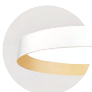
W Snow White G Satin Gold